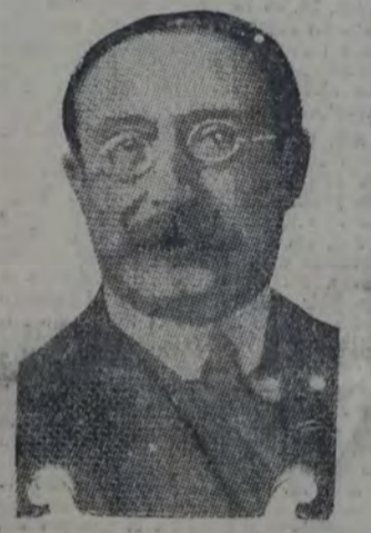
LEON BLUM, QUE ESCRIBE UN hermoso artículo sobre la personalidad de Mauricio Barrés. Ver la página 6a.