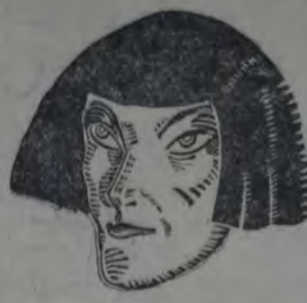
LOS OJOS DE LOS POBRES EN EL SUPLEMENTO ILUSTRADO de "La Vanguardia" del domingo.

Uno de los hermanos Ali es el autor de los disparos